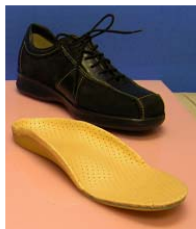
③ドイツ製革靴と足底板